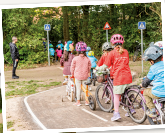
I 2023 blev Parkbåndet (t.v.) og en ny trafiklegeplads (øverst) indviet.

Kampen for rent badevand fortsætter i 2024 (t.h.), og det samme gør byggeriet af letbanen letbanen (t.v.), som på sigt giver nye muligheder.