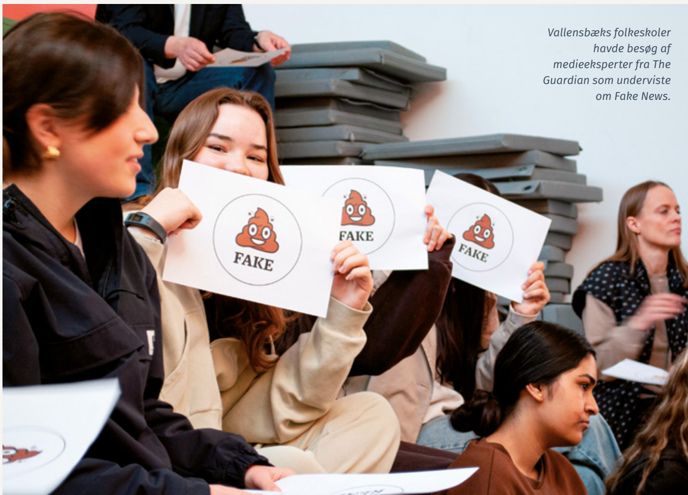
Vallensbæks folkeskoler havde besøg af medieeksperter fra The Guardian som underviste om Fake News.