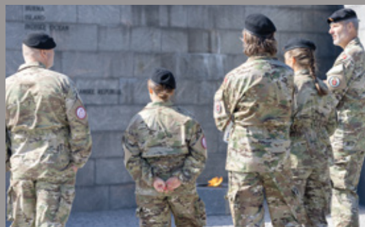
Formålet med Flagdagen er at vise taknemmelighed til alle de personer, der er eller har været udsendt på en mission.

Alle er velkomne, men af hensyn til planlægningen er der tilmeldingsfrist den 12. august.