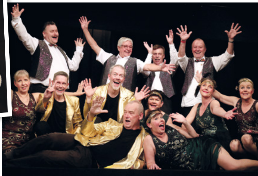
Vallensbæk Amatør Teater får også god hjælp af bl.a. teknisk personale, tekstforfattere og en masse frivillige, der går til hånde i baren, køkkenet og bag scenen.