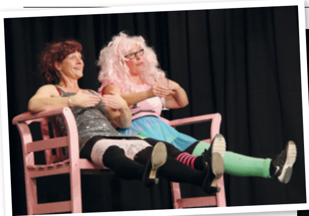
Revyen består af sketches og sange, der sætter tidens trends i et humoristisk lys.