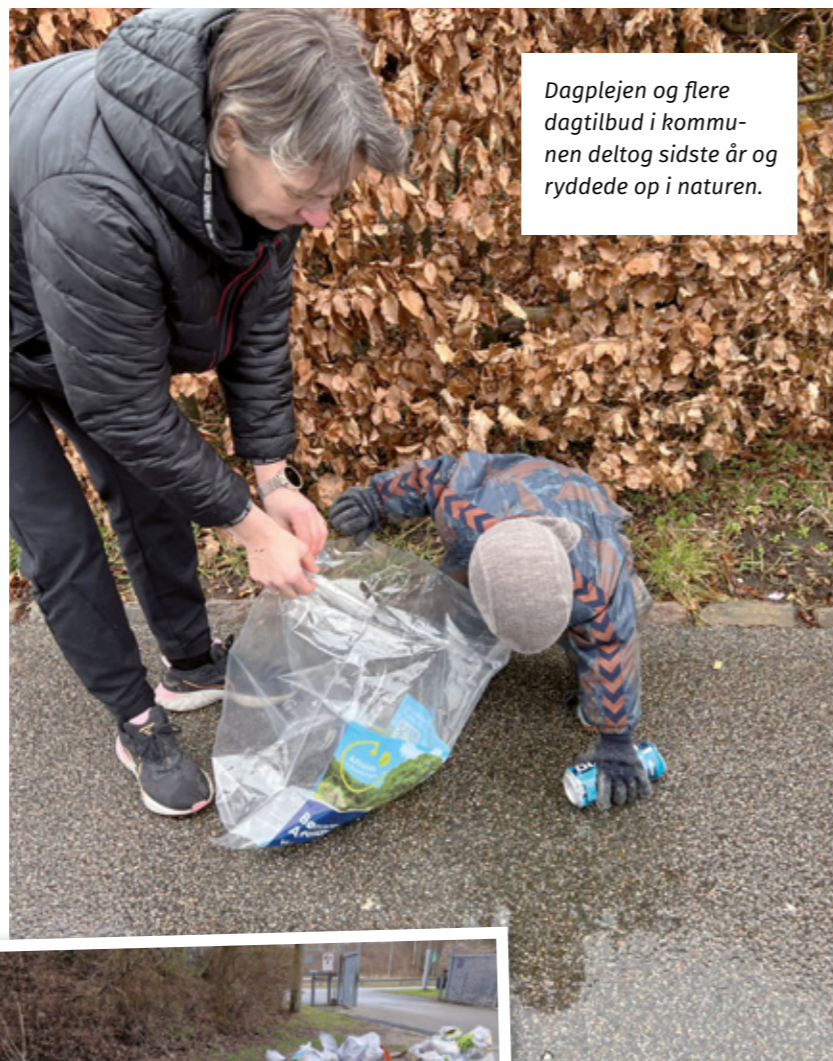
Daglejen og flere dagtilbud i kommunen deltog sidste år og ryddede op i naturen.

Alle pengesedler, der er ældre end den nuværende serie med broer og oldtidsfund, bliver ugyldige efter 31. maj 2025.