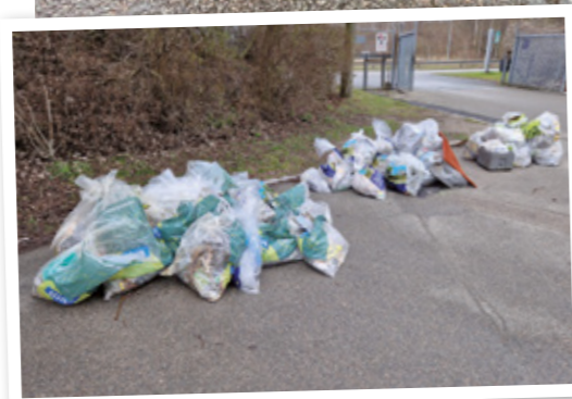
Under affaldsindsamlingen samlede Vallensbæk 160 kg. Skrald i alt.