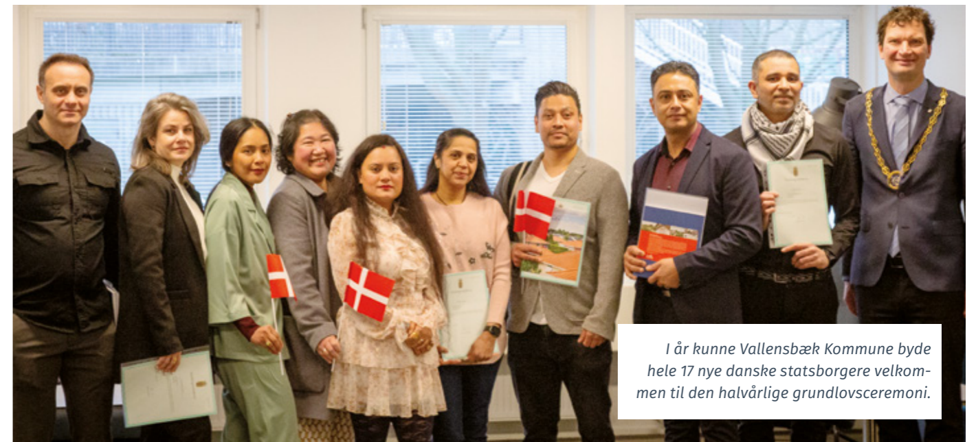
I år kunne Vallensbæk Kommune byde hele 17 nye danske statsborgere velkommen til den halvårige grundlovsceremoni.

Grundlovsceremonierne arrangeres to gange årligt for at fejre borgere i Vallensbæk, der har opfyldt kravene til at opnå dansk statsborgerskab.