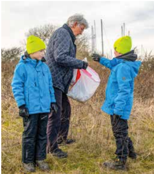
Et af indsamlingsstederne sidste år var ved Strandparken.