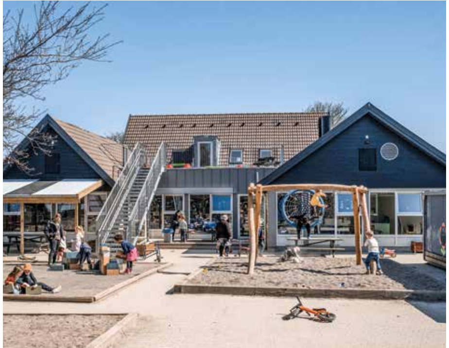
Mejsebo er en af de institutioner i Vallensbæk der er blevet nyrenoveret. Politikerne har også vedtaget at bygge en helt ny institution.

14 kommuner i Region Hovedstaden budgetterer med færre penge til de 0-5 årige