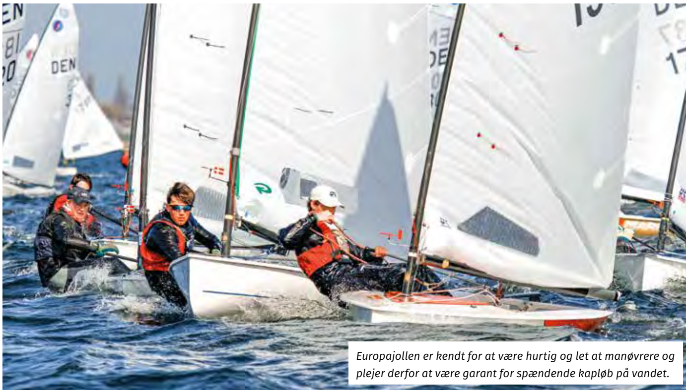
Europajollen er kendt for at være hurtig og let at manøvrere og plejer derfor at være garant for spændende kapløb på vandet.