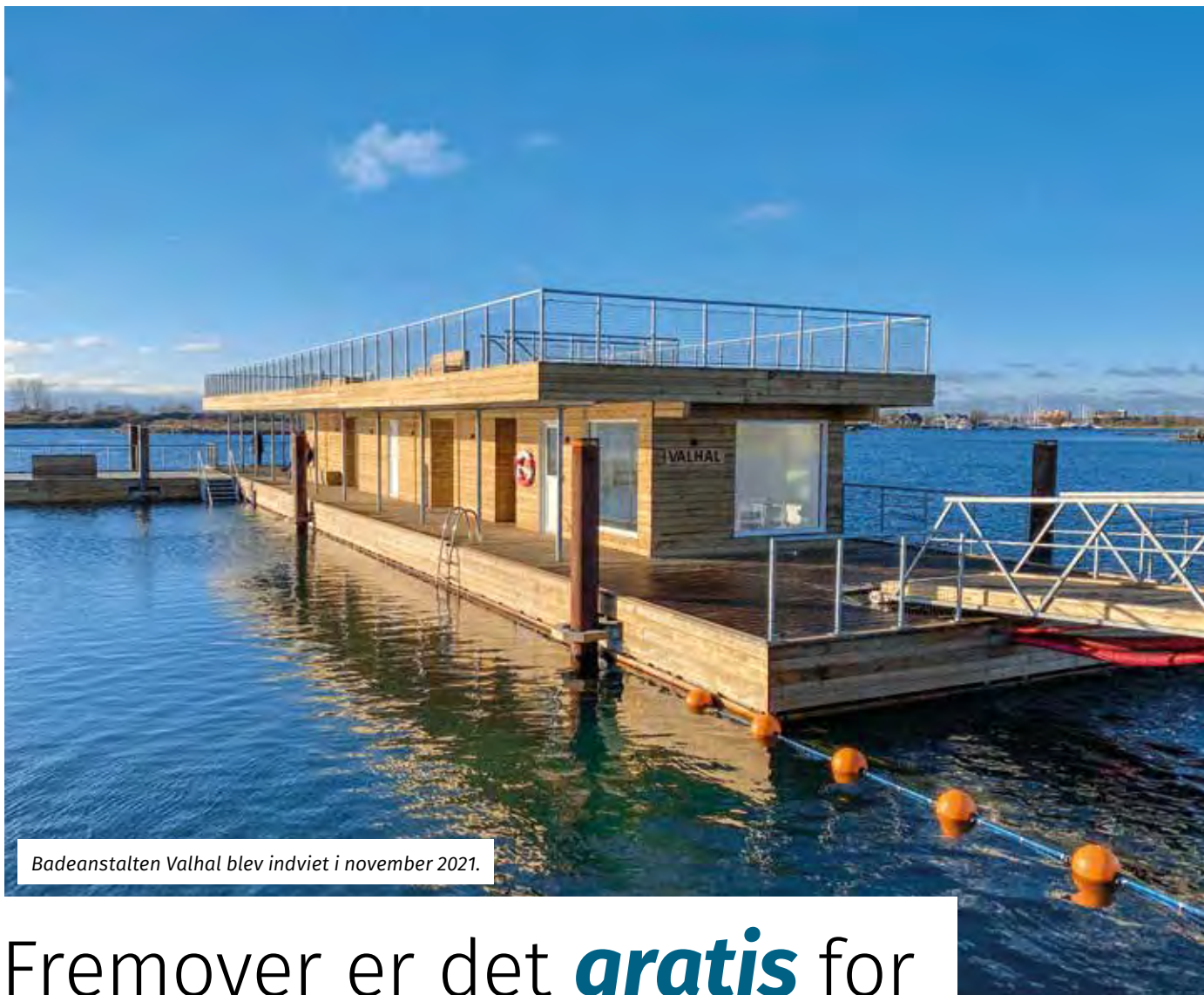
Badeanstalten Valhal blev indviet i november 2021.