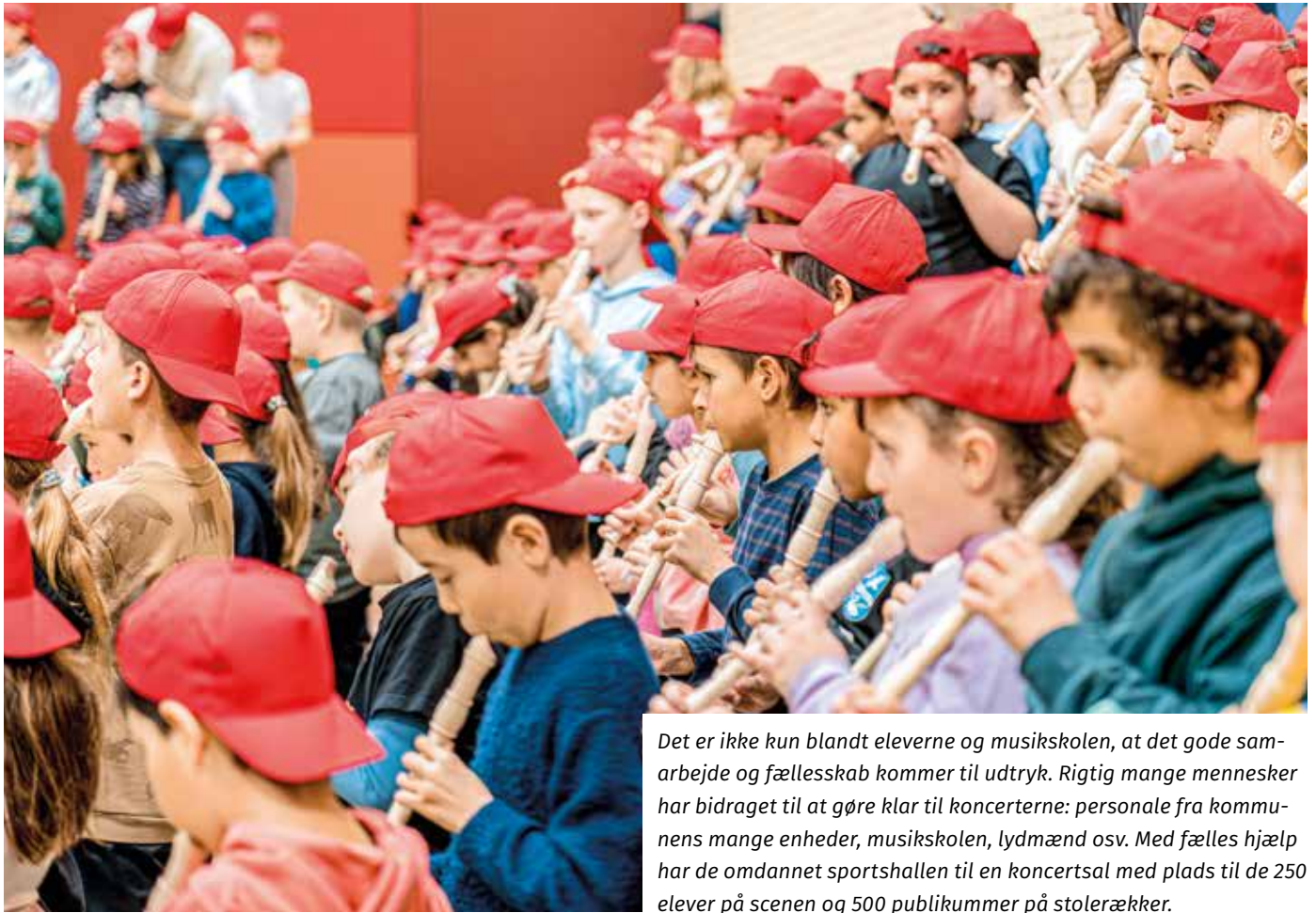
Det er ikke kun blandt eleverne og musikskolen, at det gode samarbejde og fællesskab kommer til udtryk. Rigtig mange mennesker har bidraget til at gøre klar til koncerterne: personale fra kommunens mange enheder, musikskolen, lydmand osv. Med fælles hjælp har de omdannet sportshallen til en koncertsal med plads til de 250 elever på scenen og 500 publikummer på stolerækker.