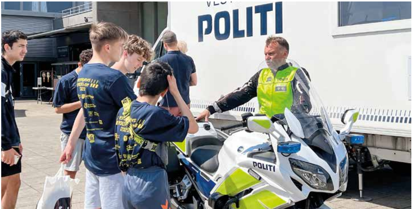
Børn, unge og politi spillede Vestegnens politicup, med hundredevis af deltagere i foråret