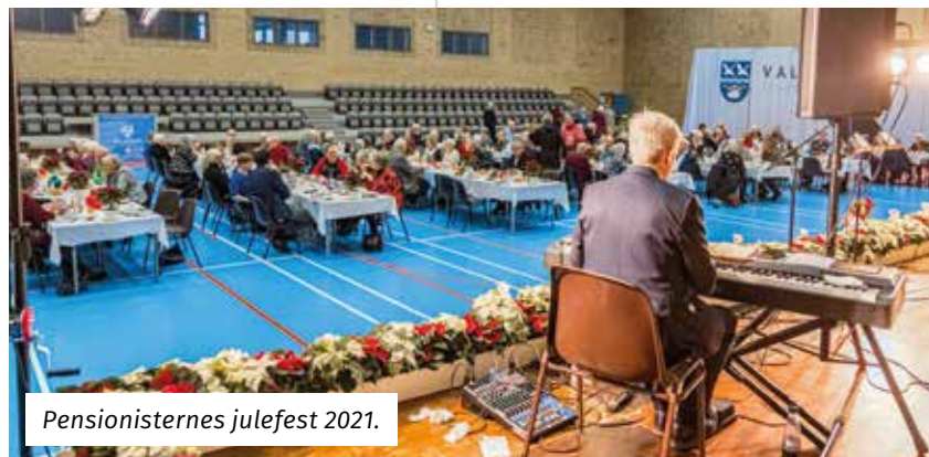
Pensionisternes julefest 2021.