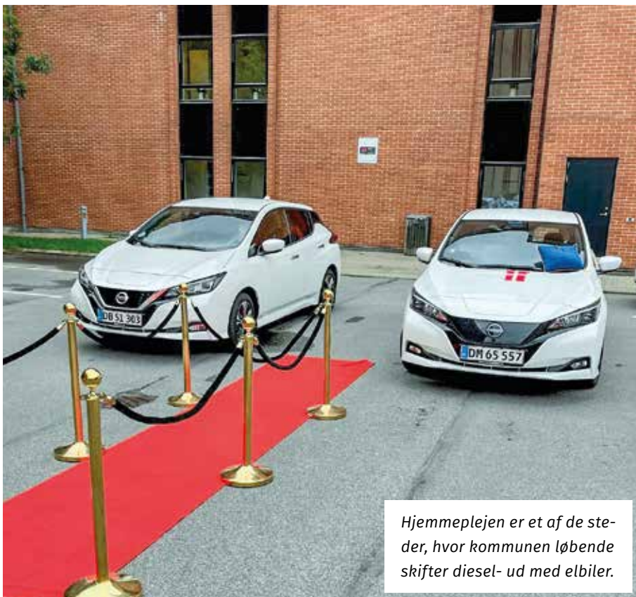
Hjemmeplejen er et af de steder, hvor kommunen løbende skifter diesel- ud med elbiler.